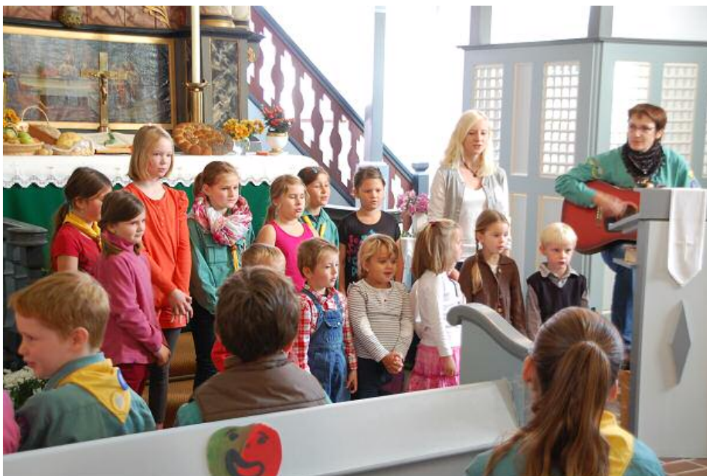
Erntedank-Gottesdienst mit der Kinderkirche

Die erste Kinderkirche im nächsten Jahr ist dann am 8. Januar zur gewohnten Zeit.