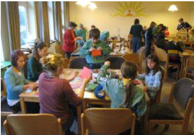
Gemeinsames Basarbasteln in St. Margare- then

Im nächsten Jahr starten wir unsere Gruppenstunden wieder am 9. Januar zu den gewohnten Zeiten.